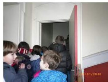
Arrivée au 2ème étage