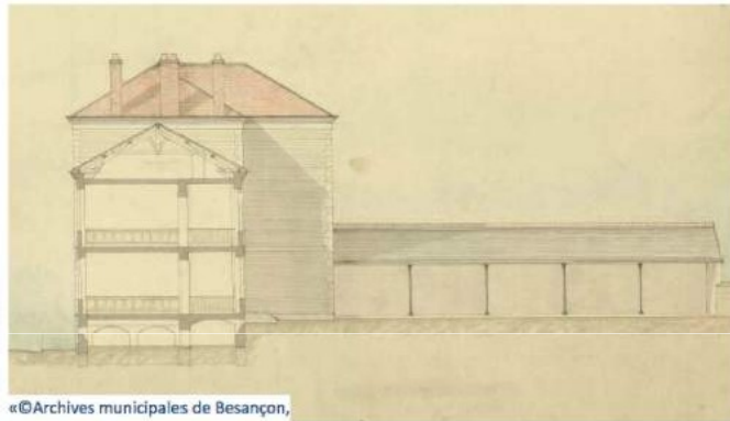
L'ancienne école des filles