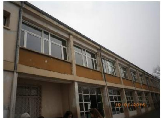
Le bâtiment perpendiculaire à l'ancienne école des filles. Nous sommes là!