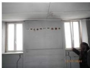
Ancienne classe 2ème étage