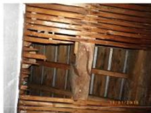
Combles Sous le clocher