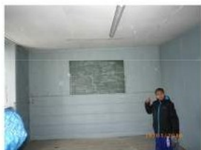
Ancienne classe 2ème étage