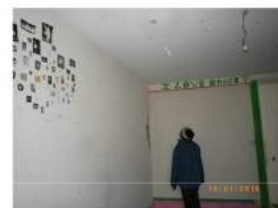
Ancien appartement 2ème étage