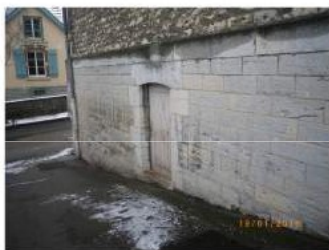
Accès aux caves , devant le portail; Au fond, la rue Baille.