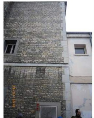
La limite entre l'ancien bâtiment et celui qui accueille 4 classes, plus récent.