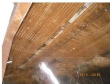
Combles Plafonds en lattes